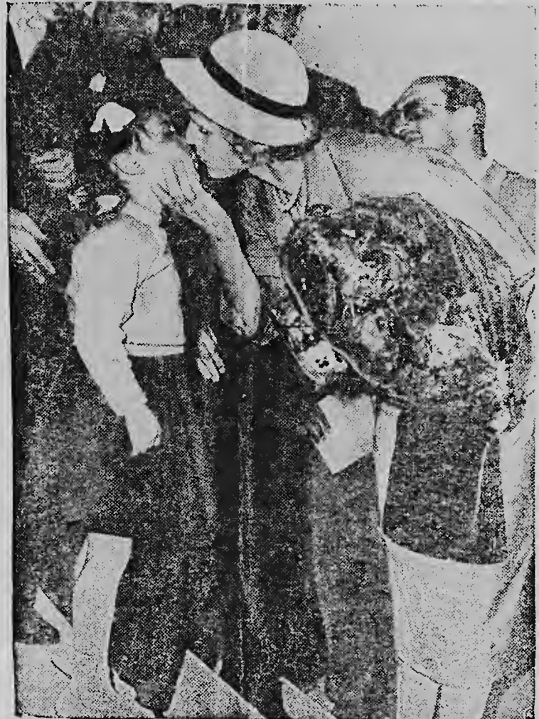
Kennelijk verrukt met de prettige en charmante manier van doen van de nieuwe Amerikaanse ambassadeur in Italië, mevrouw Clare Booth-Luce, kijken een groot aantal Italianen toe, terwijl Clare een meisje, dat haar bloemen aanbod, kust. Op haar reis door Zuid-Italië, welke twee dagen duurde, werd de ambassadeur overal ontvangen door grote menigten, welke haar luide en hartelijk toejuichten.